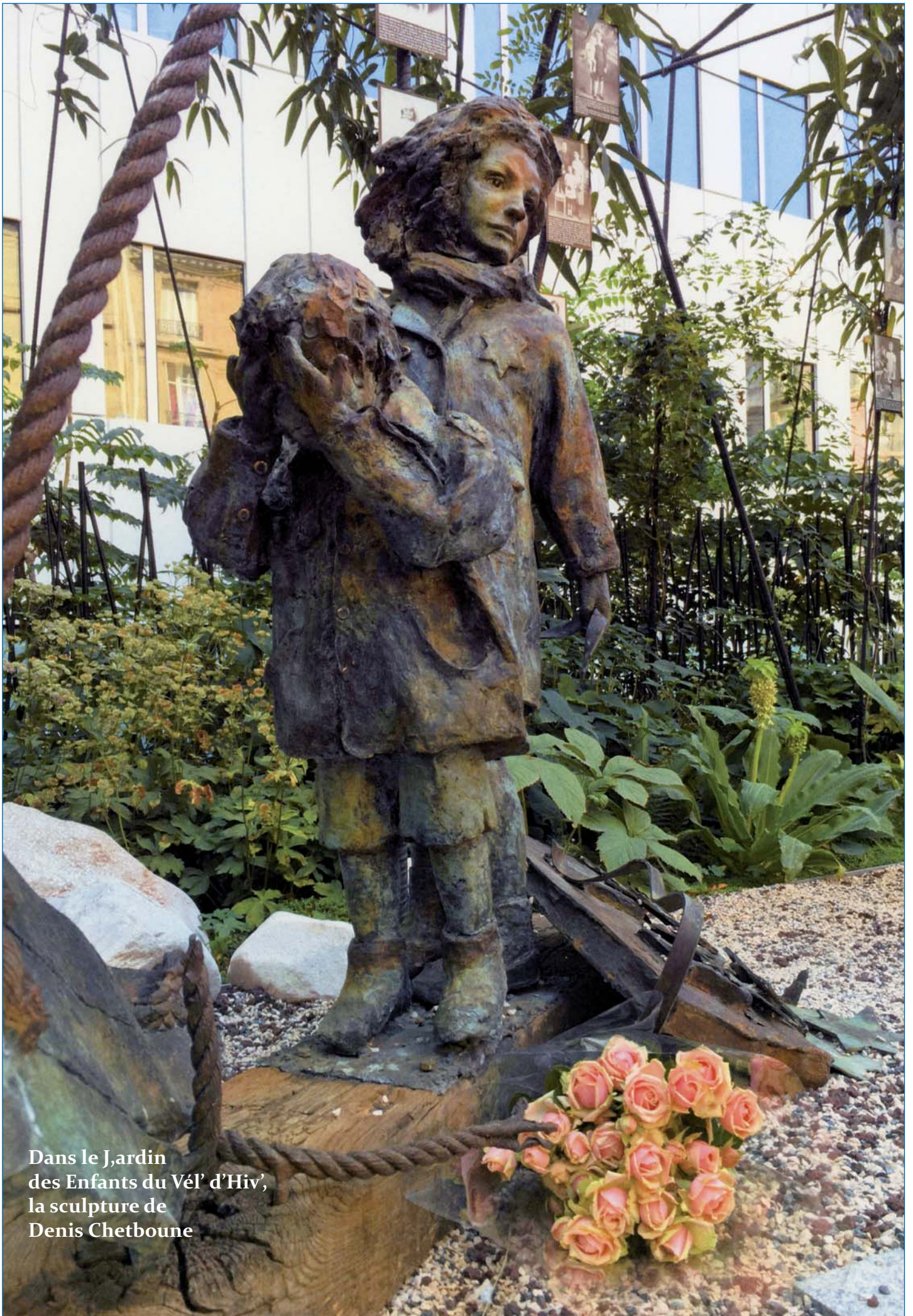
Dans le Jardin des Enfants du Vél' d'Hiv', la sculpture de Denis Chetboune