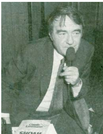
■ Mort cet été, l'auteur (ici à Radio Lyon) du documentaire sur le génocide des Juifs d'Europe était venu présenter son travail en primeur dans un cinéma de Lyon. La séance fut un flop total.