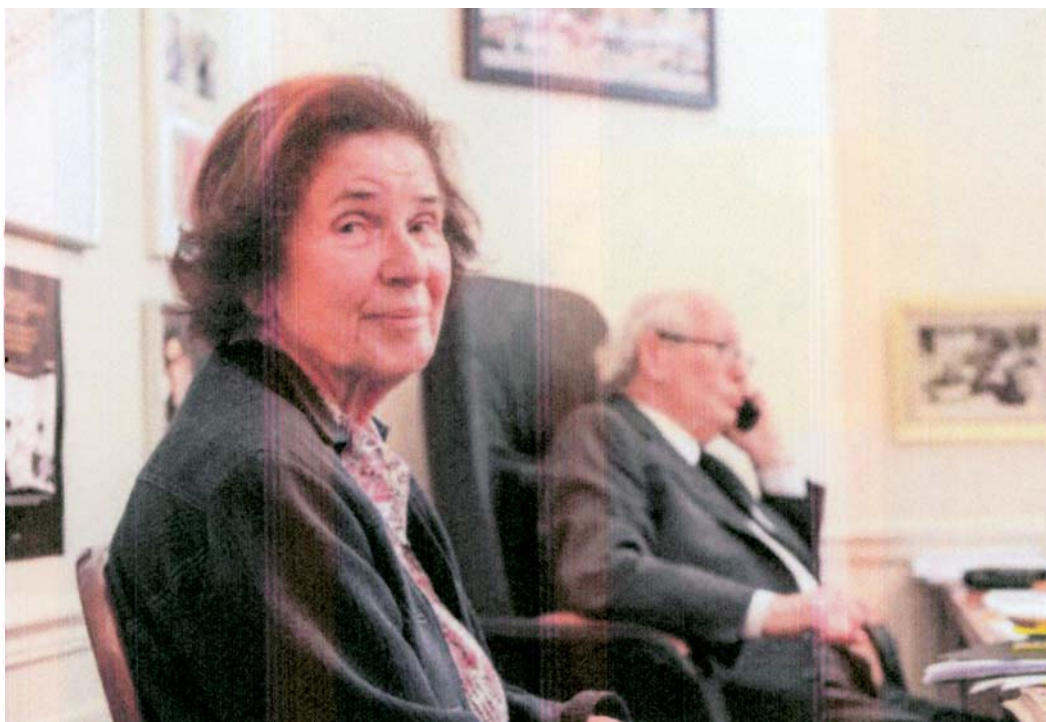
Beate et Serge Klarsfeld, rue de la Boétie à Paris, siège de leur association, Fils et Filles des déportés juifs de France.

Il y a cinquante ans, Beate Klarsfeld administrait une gifle au chancelier allemand Kiesinger, ancien cadre nazi. Cet acte a marqué le début de la traque des Klarsfeld des hommes d'Hitler